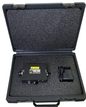
Shown with optional carrying case